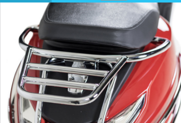
SUPPORT DE TOP-CASE KA-01-0617