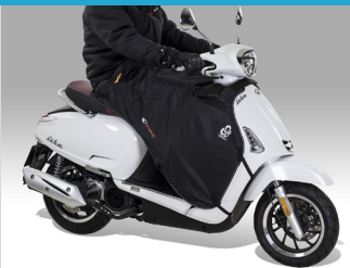
TABLIER DOUBLE 8 KA-01-0499