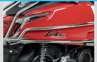
BARRES LATERALES ARRIERES CHROME KA-01-0493